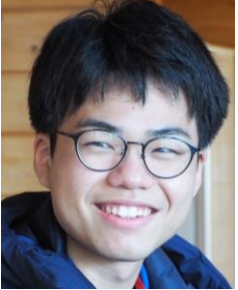
本田翔太さん（仮名）（2021年度参加）

私は里親家庭で幼少期から育っていますが、ビヨンドトゥモローの仲間と出会う前はあまり似た境遇の同世代の方と関わる事がなく、境遇の事で悩み苦しんでいるのは自分だけだと思い、孤独感を感じていました。しかし、ビヨンドの仲間と出会い、バックグラウンドをシェアする事によって、似た境遇で育った仲間がいるという事を実感でき、「皆も未来を向いて頑張っているのだから自分も過去じゃなく未来を見て頑張らなきゃいけない」と感じ、前を見て生きることができるようになりました。